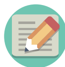
papelógrafo o computador